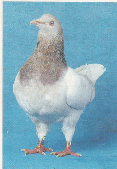
Masná plemena holubů jsou na první pohled typická svou širokou hrudí. Na snímku Ladislava Fišera texan

U nás je situace velmi špatná, protože holubí maso není nijak ceněno. Otevřeně říkám, že se mi chov vyplatí, ale to je dáno tím, že prodávám holuby zemědělským družstvům a státním statkům na velkochov k rozmnožení. Kdo nemá P-chov, musí nutně prodělávat. Stejně tak nerentabilní je vzhledem k drahému krmivu chov holubů na maso. O tom, jak je holubí maso oceňováno v USA, svědčí nejlépe to, že Maďarsku, odkud se exportuje za oceán, dodáváme kilogram za 14 dolarů. U nás například v zemědělském družstvu Blatnice, kde je jeden z našich velkochovů, dávají za kilogram asi sedm-