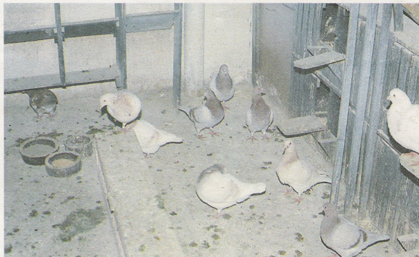
Budníky pro giganty (vlevo) i texany je vhodné umísťovat pouze ve dvou řadách nad sebou

zase vrátit zpátky. Protože neradi létají, krmím v holubníku. Nestalo se mi zatím, že bych o některého přišel. Giganti mají ze svého holubníku možnost výletu do voliéry, kde mají také možnost koupání.